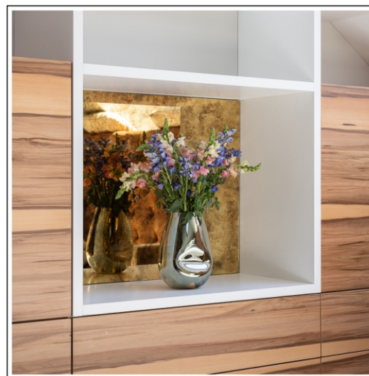
nieka ekspozycja ze złotym antyrefleksyjnym lustrem