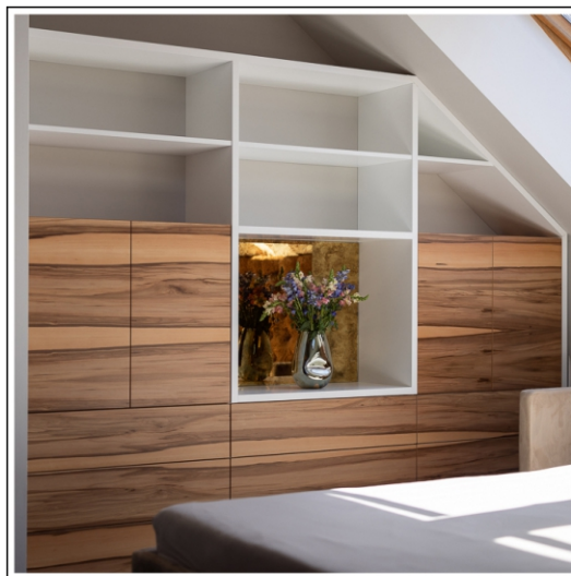
ukoszenie ściany regał do sypialni na poddaszu