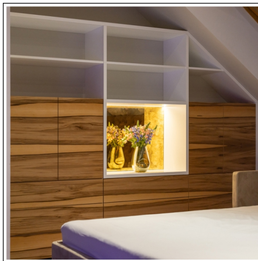
ukoszenie ściany regał do sypialni na poddaszu - wieczór