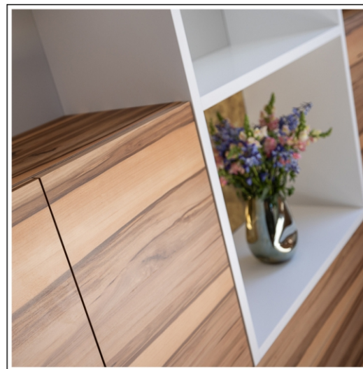
konstrukcja ramowa z lakierowanego biały mat MDF-u