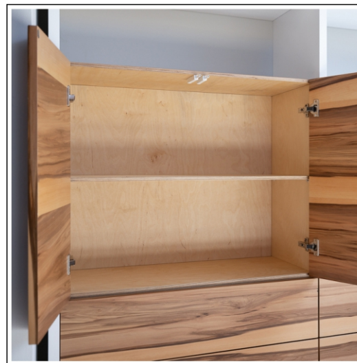
korpusy szafek z brzozonej sklejki, fronty bezuchwytowe (TIP-ON)