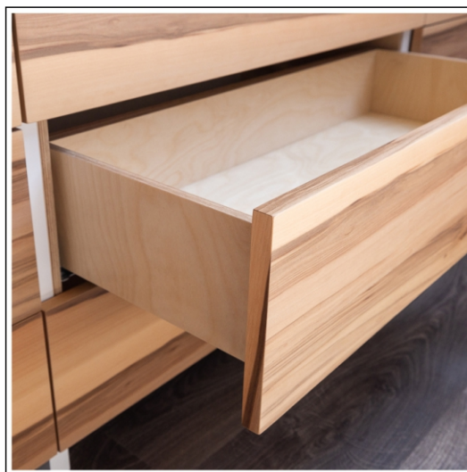
szafka szuflad z brzozonej sklejki, schowane prowadnice