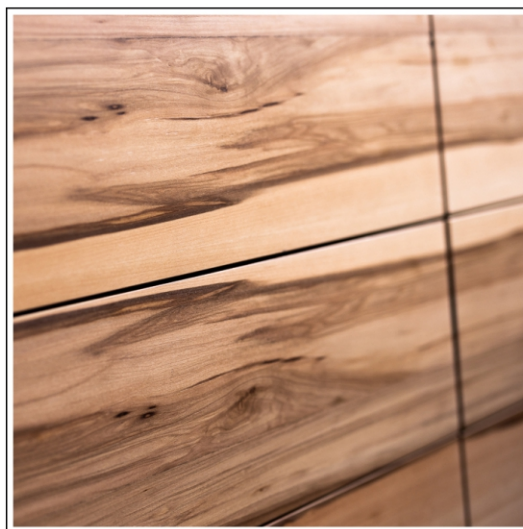
rozcięcie dobrego wzór faktury - orzech saski